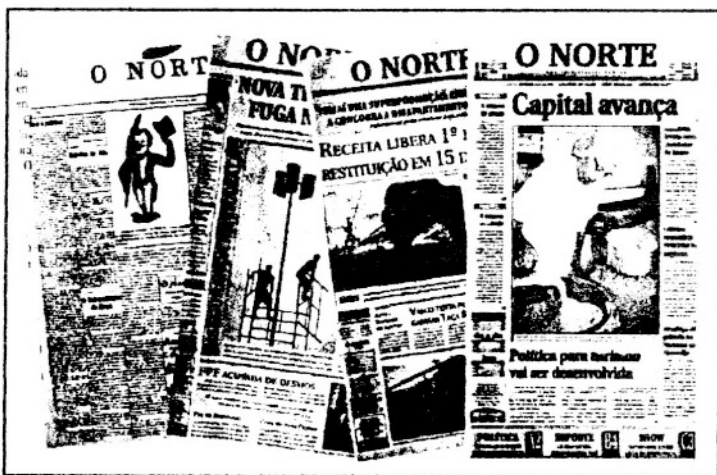
Vários projetos gráficos do jornal O Norte

prensa, O Norte procura dar destaque à utilização das cores como fator de atração, e isto está de acordo com as novas tecnologias e o relativo barateamento dos custos, coisa praticamente impensável há poucos anos. No entanto, o uso indiscriminado de cores, fontes e demais elementos gráficos disponíveis em qualquer programa de com-