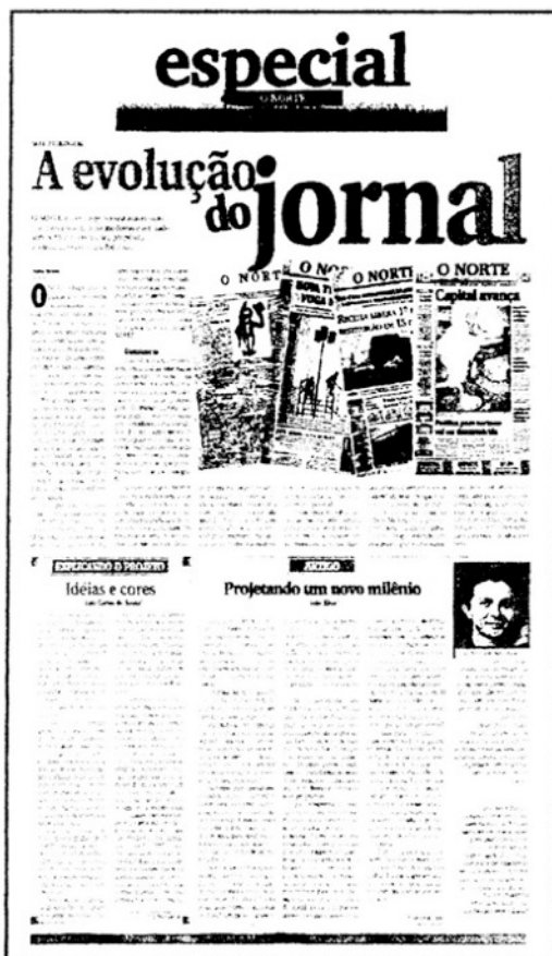
Capa do caderno especial de O Norte , de 7 de maio de 2001