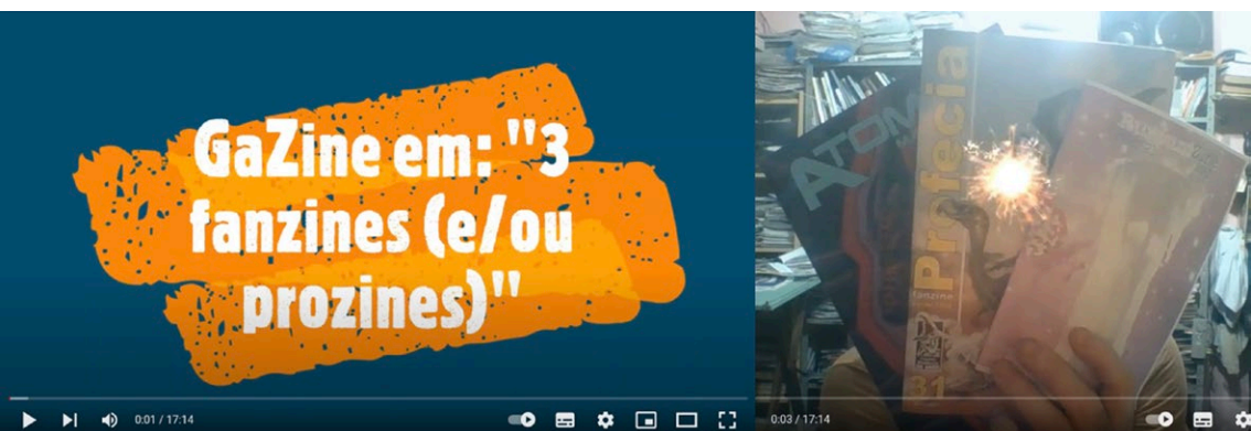
Figs. 5 e 6: Introdução de um dos episódios de GaZine .

Assim, venho apresentando vídeos que versam acerca dos fanzines e seu potencial artístico e educacional: os de formatos distintos bem como os de temas diversos e sua inserção histórica mundial e concepções (figs. 5 e 6), além de explorar livros pertinentes ao universo zineiro, flertando vez ou outra com quadrinhos e cultura pop e/ou underground (alternativa) quando necessário.