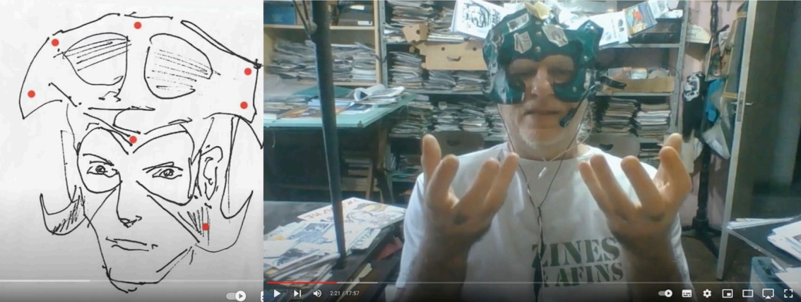
Figs. 1 e 2: projeto da máscarazine à esquerda e ela sendo utilizada, à direita, no GaZine (e ao fundo da foto, o cordelzine). Fontes: https://www.youtube.com/watch?v=O9zdDFjppOs (fig. 1) e https://marcadefantasia.com/relicario/relicario2021-2025/relicario2021/barnardzinelibrary/barnardzinelibrary.html (fig. 2)

Após a gravação de cada vídeo pelo notebook – usando a câmera ou então o programa OBS Studio –, eu o edito dando alguns efeitos e depois o posto no youtube descrevendo dados ao veiculá-lo, compartilhando-o no facebook , tweeter e Instagram (neste último eu reinsiro o mesmo vídeo).