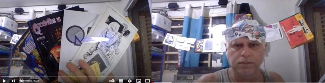
Figs. 3 e 4: uma das aberturas de um dos GaZines (fig. 3) e máscara na primeira versão e ao fundo, o cordelzine (fig. 4). Fontes: https://www.youtube.com/watch?v=vXBBNXx-Dto

Assim, venho apresentando vídeos que versam acerca dos fanzines e seu potencial artístico e educacional: os de formatos distintos bem como os de temas diversos e sua inserção histórica mundial e concepções (figs. 5 e 6), além de explorar livros pertinentes ao universo zineiro, flertando vez ou outra com quadrinhos e cultura pop e/ou underground (alternativa) quando necessário.