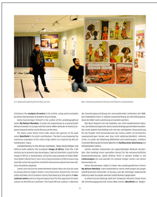
II. 2. Adding the labelling after the floor was laid.

Em sequência, temos um estudo acerca de personagens e estereótipos como estratégia narrativa, por Jakob F. Dittmar. Este artigo possui suma importância, pois nos comica a mensagem é, por natureza, expressa de forma sintética e com isso utilizamos es-