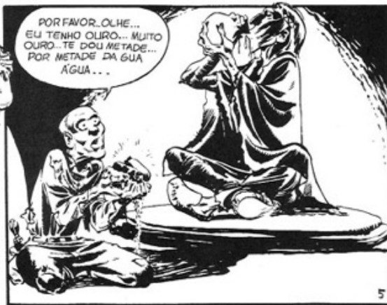
Fig. 3. Eisner. Página 4 da HQ "Quirte".