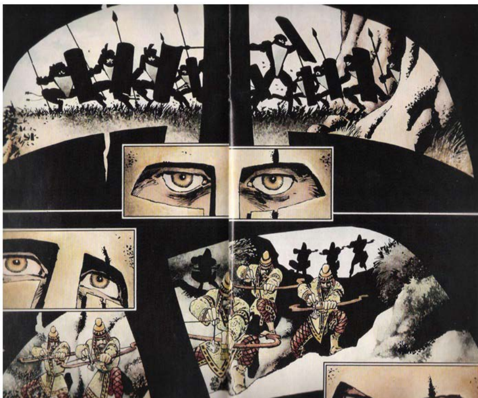
Fig. 4. Página da HQ Os 300 de Esparta .

Fonte: MILLER, Frank. Os 300 de Esparta . São Paulo: Abril, 2006