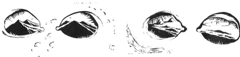
Figs. 1 e 2. Eisner. Excerto da HQ “Quirte”.

Qual o nome único, aquele impronunciável, para esta arte estranha, paradoxal e excêntrica arte dos quadrinhos em que subjaz o potencial o qual permanece inato nos vazios entre seus requadros, entre as cenas desenhadas, portanto, sendo quadrinhos ex-cêntricos: fora dos centros, em algum lugar no limbo, que brincam com as imagens, simulam movimento, misturam-se às palavras, mas que pareceram anteriormente não despertar atenção aos adultos racionais que valorizam em exagero a escrita fonética e a ciência clássica, unilateral e anacrônica?