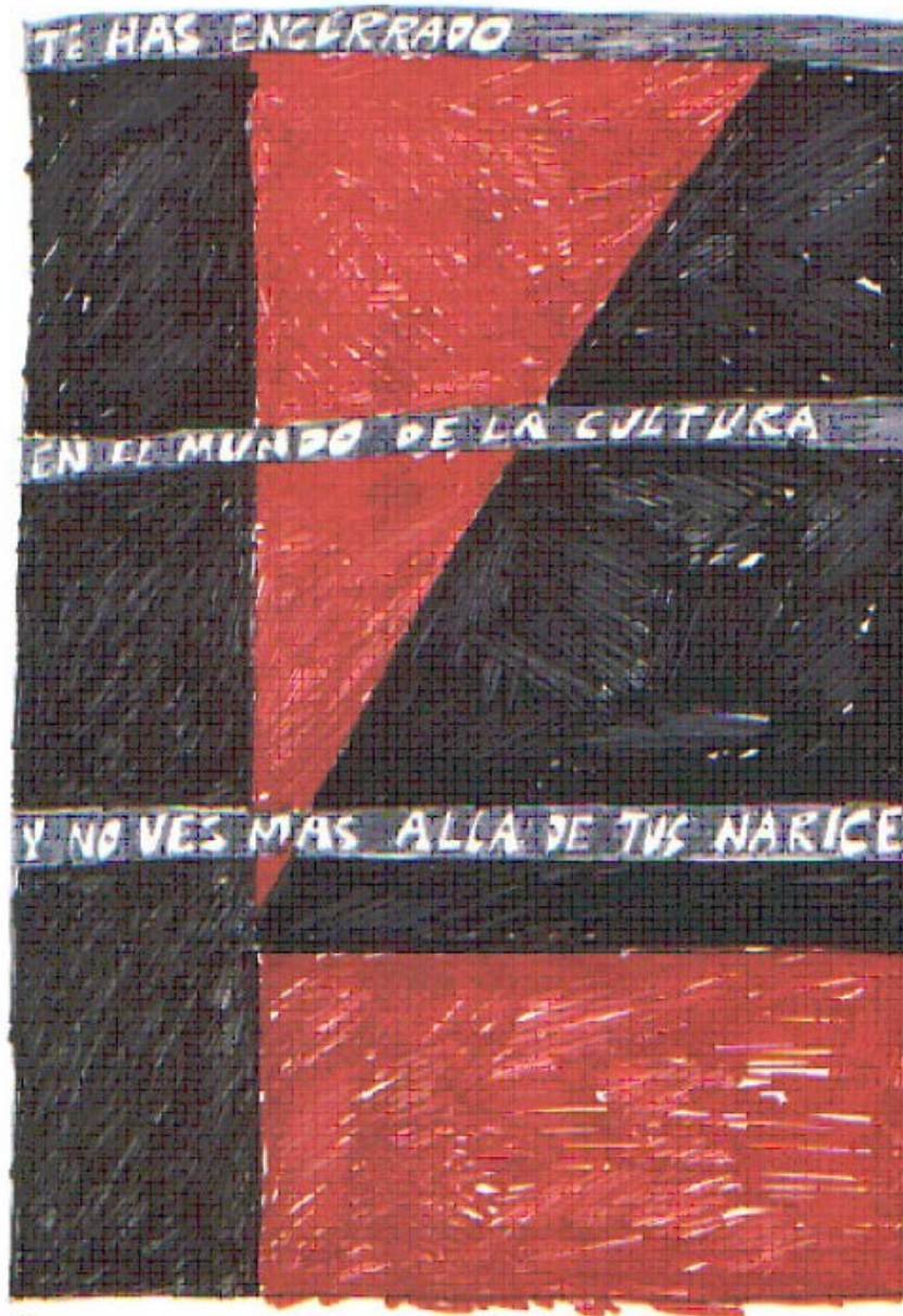
Fig. 5. HQ do autor espanhol Rubén.